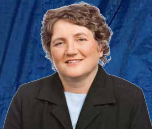
von Kirsten Tackmann