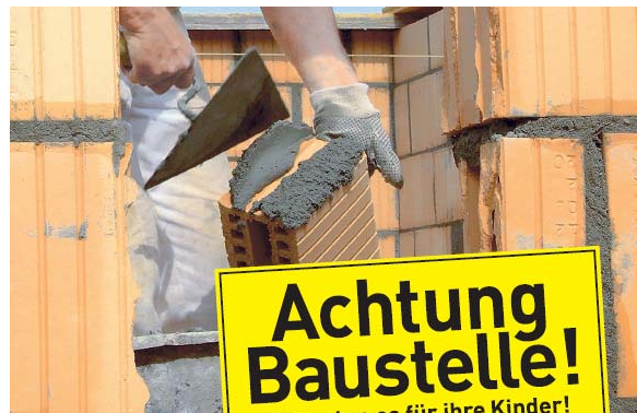
Hier errichten notorische Weltverbesserer

In unseren Parteistrukturen und unseren parlamentarischen Strukturen gibt es immer wieder eine erstaunliche Unempfindlichkeit gegenüber platten Oben-Unten-Verhältnissen. Außer der menschlichen Verführbarkeit spielen dabei auch die extreme Wertigkeit von Effektivität, Medialität, äußerer Anerkennung eine Rolle – sowie die schlichte Unkenntnis von Instrumenten und Techniken, mit denen eine linke politische Kultur Hierarchien entgegenwirkt. Es gibt nicht nur die quotierte Redeliste, sondern auch die rotierende Sitzungsleitung, Redezeitbegrenzungen auch für Vorsitzende, Arbeit in flexiblen Teams,