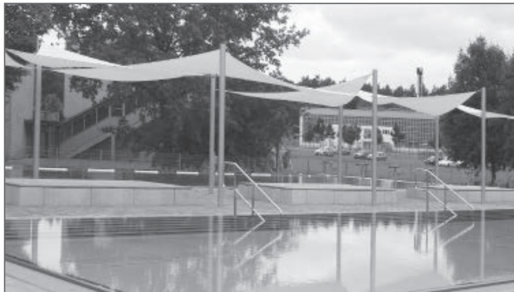
Pünktlich zum Saisonauftakt wurde das sanierte Freibad in Bernau-Waldfrieden dem Badebetrieb übergeben. Schwimmer können sich an der erhaltenen 50-Meter-Bahn erfreuen, Familien an den großen Liegewiesen, Kinder am Nichtschwimmerbecken und an den Sprungtürmen. Bernau ist damit um ein Schulsport- und ein Freizeitangebot reicher. Zum Tourismus und zum Rückkauf von Seen lesen Sie auf Seite 10/11.