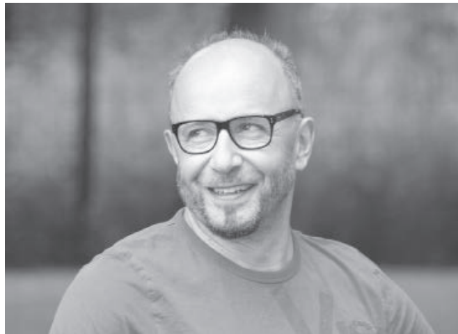
Michael Luthardt, Landtagsabgeordneter der LINKEN: Sicherung der Gewässer für die Allgemeinheit.

Hintergrund dieser Käufe durch das Land sind die Privatisierungen von Seen, Flüssen und Teichen, die viele Jahre lang durch die BVVG betrieben wurden. Im Barnim war das Thema explodiert, als der Wandlitzsee für 400.000 € an einen Immobilienbesitzer verkauft wurde. Dieser forderte plötzlich von der Gemeinde