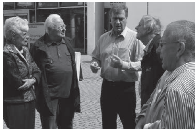
Sprechstunde unter freiem Himmel 2013: Wirtschaftsminister Christoffers im Gespräch vor dem Rathaus Panketal am S-Bahnhof Zepernick.

15 bis 16 Uhr, am Gartencenter Holland mit Ralf Christoffers