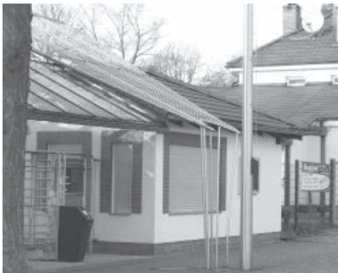
Hier fing alles an: Als die Gemeinde Wandlitz für die Nutzung des privaten Sees und die Betreuung des Strandbades 50.000 € zahlen sollte ....

Aber durch „Rot-Rot“ wurde das Verfahren in Brandenburg gestoppt. Aus den bisherigen Käufen wurden 6 Gewässer aus Naturschutzgründen an die Forstverwaltung weitergereicht, 14 weitere gingen aus demselben Grund an die Stiftung Naturschutzfonds.