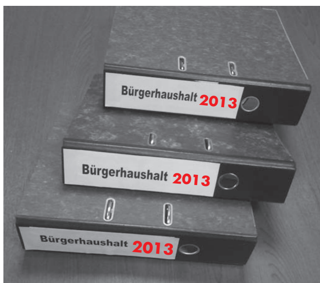
Wird die Übung diesmal gelingen?

zeugen konnte, denn die Zahl der Vorschläge für den Bürgerhaushalt stieg gegenüber 2011 noch einmal an, und auch die finanzielle Größenordnung einiger Vorschläge war deutlich gestiegen. Sogar der außerordentlich sparsame Verwaltungsdirektor fand dann, dass es doch eine gute Idee war, das Budget in der beschriebenen Weise auszuweiten. War nun alles gut? Keineswegs. Für den Bürgerhaushalt 2012 hatten sich neben vielen einzelnen Bürgern auch drei Sportvereine beteiligt. Zum Abstimmungstag hatten diese dem Anschein nach ihre gesamte Mitgliedschaft mobilisiert. Da die Reihenfolge der Vorschläge nach der Anzahl der Stimmen für einen Vorschlag entschieden wird, waren sie natürlich klar im Vorteil gegenüber den Einzelschlägen. Neuer Bürgerfrust also. Dem soll nun eine neuerliche Satzungsänderung abhelfen. Aber keiner weiß so richtig, wie. DIE LINKE hatte zur ersten Diskussionsrunde im städtischen Finanzausschuss zwei Vorschläge gemacht. Zum einen sollte