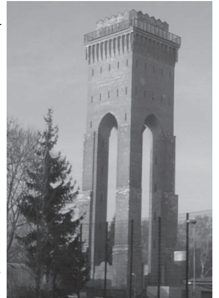
Wer sich ganz anders mit Wasserfragen beschäftigen will: Wasserturm in Finow. Er wurde 1917/18 zur Versorgung des industriellen Umfeldes durch die Hirsch, Kupfer- & Messingwerke AG erbaut und ist das Wahrzeichen des Finowtales. Nach 261 Stufen hat man den herrlichsten Ausblick. Über die Wintermonate ist der Turm geschlossen. Dafür von 17.00 bis 23.00 Uhr angestrahlt. Ab Karfreitag 2013 ist er wieder geöffnet. Mehr Informationen unter: www.wasserturm-finow.de

Anders sieht es demzufolge in Regionen aus, in denen Grundstückseigentümer – oft auch mit niedrigem Einkommen, z.B. Rentner – ihre Grundstücke selbst nutzen, in Panketal zum Beispiel. Hier setzt sich die LINKE für eine Umstellung von einem Beitrags- auf ein Gebührenmodell ein, aber auch nur – das ist zu beachten – für das Trinkwasser. Abwasser soll ihrer Auffassung nach weiterhin über Beiträge finanziert werden. Vor diesem Hintergrund hat sich in Panketal eine Bürgerinitiative „Sozialverträgliche Kostenbeteiligung Trinkwasser“ gegründet, die einen entsprechenden Einwohnerantrag in die Gemeindevertretung einbringen will (siehe Außenspalte).